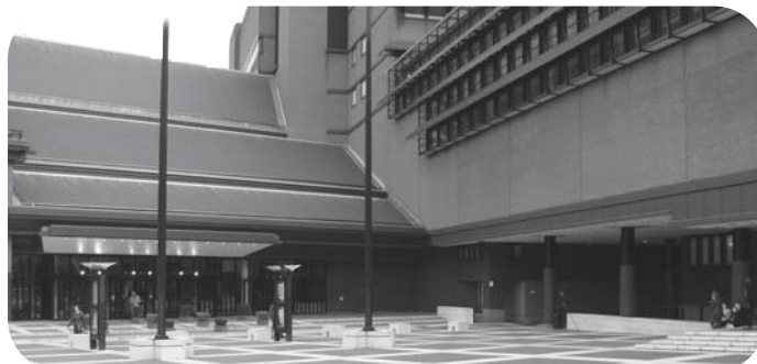
BRITISH NATIONAL LIBRARY БРИТАНСКА НАЦИОНАЛНА БИБЛИОТЕКА