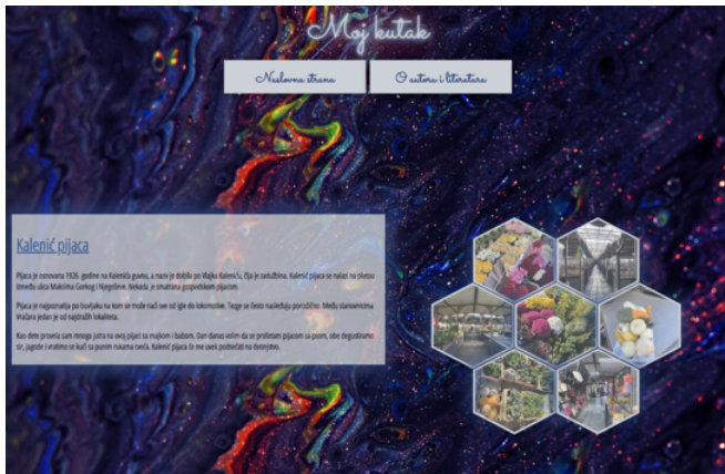
Слика 5. Приказ стране трећег степена

уознавање са земљом у којој живимо (Слике 5 и 6) и на тај начин се придружили низу сличних пројеката које су радиле раније генерација за потребе курса Мултимедијални документи, попут пројекта „Ал’ се некад добро јело” генерације 2012/2013, у оквиру ког су студенти сакупљали материјал везан за традиционалну српску кухињу, или пројекта „Игра рокенрол цела Југославија” генерације 2014/2015, која је за циљ имала „да на једном месту прикаже што обухватнију грађу о почецима и развоју рок сцене на просторима бивше Југославије”. 6