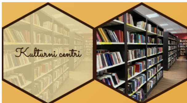
Слика 2. Приказ анимације саћа, пре и после