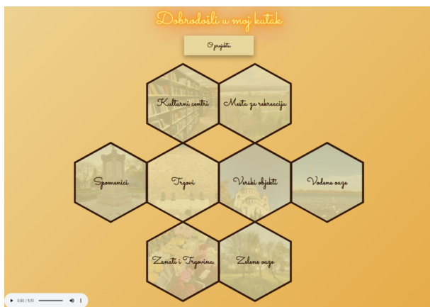
Слика 1. Изглед Насловне стране

На свако саће стављена је анимација која, када се курсор корисника нађе изнад саћа (hover), чини да нестане назив опште категорије и открива се слика којом је категорија представљена. Ауторка фотографија је чланица тима, Валентина Ивановић. Поред анимација и слика, саћа имају функцију, кликом на њих воде до другог степена са којим су повезане путем релативних адреса (Слика 2).