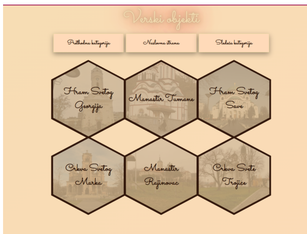
Слика 3. Приказ другог степена