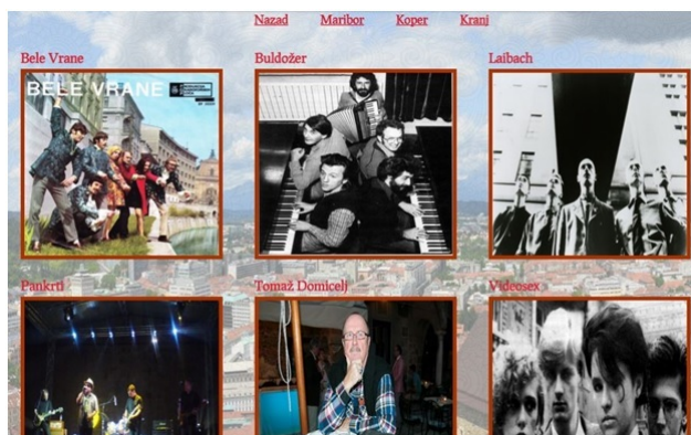
Слика 2. Пример странице за град – Љубљана

Последњи скрипт, bend.php садржи само једну везу – за повратак назад. Улога ове скрипте је да у два одвојена одељка прикаже биографију и дискографију изабраног извођача или бенда. За сваки албум одабраног извођача се наводи назив, годиште и издавач, а уколико постоји, приказана и је слика омота одговарајућег албума. По учитавању странице, аутоматски се покреће репродукција унапред одређене музичке нумере одговарајућег извођача, а у позадини странице се налази његова слика.