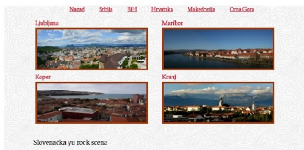
Слика 1. Пример странице за регион – Словенија

Најпре је састављена основна композиција веб сајта у чијој је сржи била хијерархијска архитектура. Уместо да се за сваки регион, град, бенд праве