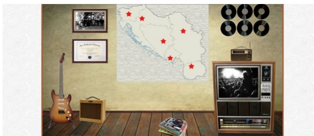
Слика 4. Изглед почетне странице

Како постоји велики број могућих исхода страница, неопходно је било пронаћи им одговарајућу заједничку тему (боју). За доминантну боју изабрана је нијанса црвене (\#dd2233), уз серифни фонт prociono . За боју заглавља је одабран дезен јагоде. Заглавље је заједничко за све странице мултимедијалног документа и састоји се из главног менија, контроле за репродукцију звука (audio player) и контрола за претрагу. Ови саставни делови остављени су да плутају применом CSS-својства float, чиме се жртвује флексибилност зарад изгледа, под претпоставком да ће документ бити прегледан на рачунару стандардне резолуције.