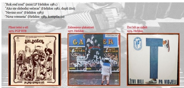
Слика 3. Пример странице за извођаче – Булдожер

Како постоји велики број могућих исхода страница, неопходно је било пронаћи им одговарајућу заједничку тему (боју). За доминантну боју изабрана је нијанса црвене (\#dd2233), уз серифни фонт prociono . За боју заглавља је одабран дезен јагоде. Заглавље је заједничко за све странице мултимедијалног документа и састоји се из главног менија, контроле за репродукцију звука (audio player) и контрола за претрагу. Ови саставни делови остављени су да плутају применом CSS-својства float, чиме се жртвује флексибилност зарад изгледа, под претпоставком да ће документ бити прегледан на рачунару стандардне резолуције.