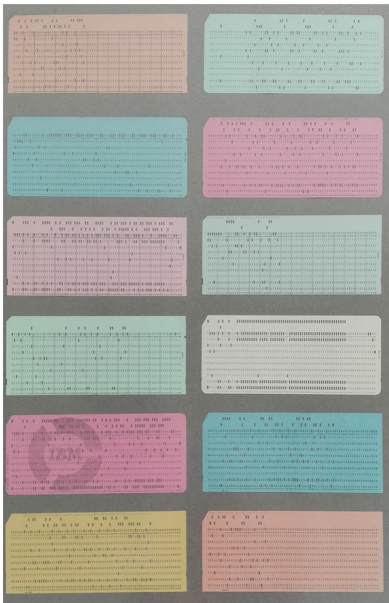
Слика 3. Визуелна песма 1970, колаж на картону 71 × 50 цм, Мирољуб Тодоровић (Скопље, 1940) (из поставке Музеја савремене уметности у Београду 2018.)