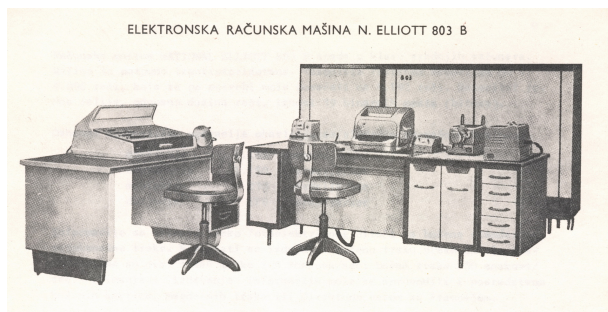
Слика 1. Изглед машине ЕЛИОТ 803 Б према (Simonović and Krunić, 1964)

развијши на њој свој знаменити алгоритам за сортирање quicksort као и једну имплементацију језика Algol 60 (Hoare, 1980).